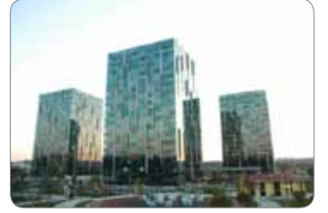
Istanbul European Side Nish Istanbul