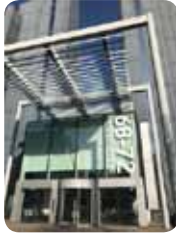
London Branch Office