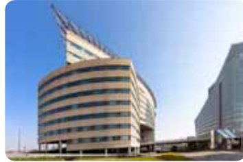
Rotterdam Branch Office