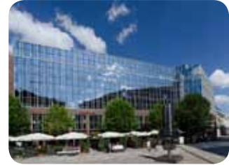
Hamburg Branch Office