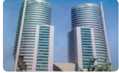
Dubai Branch Office