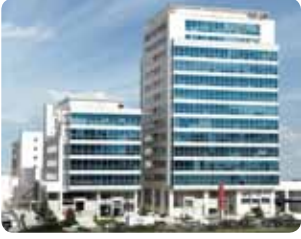
Merkez / Head Office