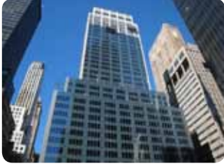
New York, U.S.A. Branch Office