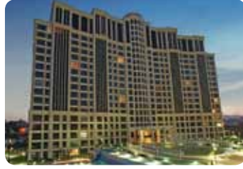
Istanbul Anatolian Side Deluxia Palace